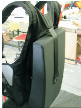
2-Identifique se o seu protetor está fixado assim – velcro costurado mais alto que o protetor