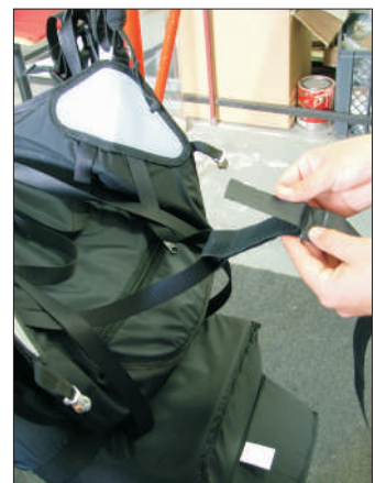
6-Tem 2 abas para uma melhor fixação