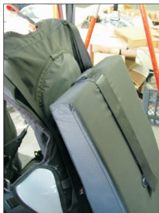
8-Deixe o velcro justo para que o protetor não suba com o manuseio.