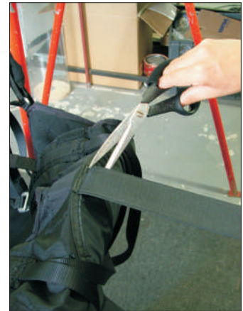
3-Schneide das ursprüngliche Klettband ab.