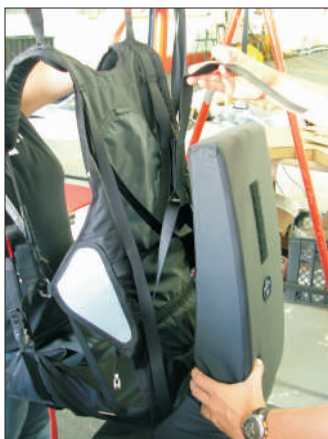
7-Nachdem das Klettband installiert ist, befestige nun wieder den Protektor.