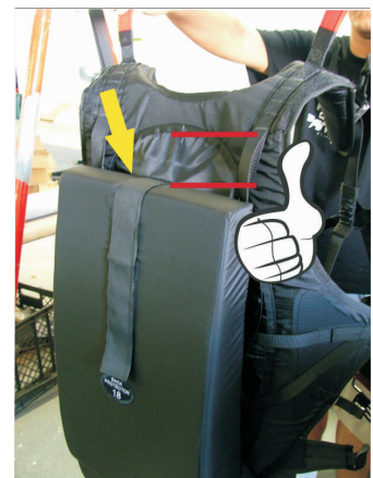
9-So ist es richtig!