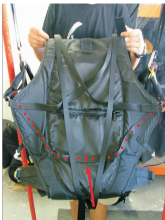
4-Identifiziere den Gurt, der von einer Seite zur anderen reicht .