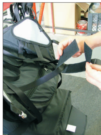
5-Bringe das neue Klettband am Gurt an.